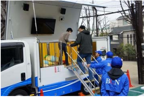
地震体験車による震度7クラスの疑似体験