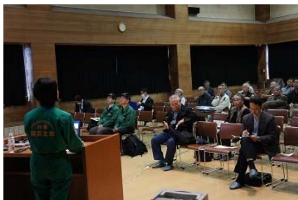
講演「市民トリアージってな〜に」

「首都直下型地震発生時に世田谷区では負傷者が約 7,400 人、その内重傷者が約 1,400 人と予測されています。病院は命にかかわる重傷者の受け入れを優先したいが、誰がこれを区分するのが問題となります。重傷かどうかは負傷者自身では決められません。行政や医療関係者だけでは、対応する人員が足りません。市民によるトリアージの考え方がここから生まれました。」と問題認識を促す講師の話に導かれながら「市民トリアージ」について