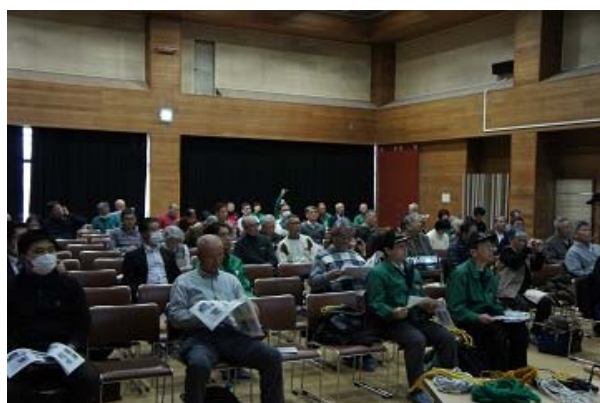
防災リーダースキルアップ研修