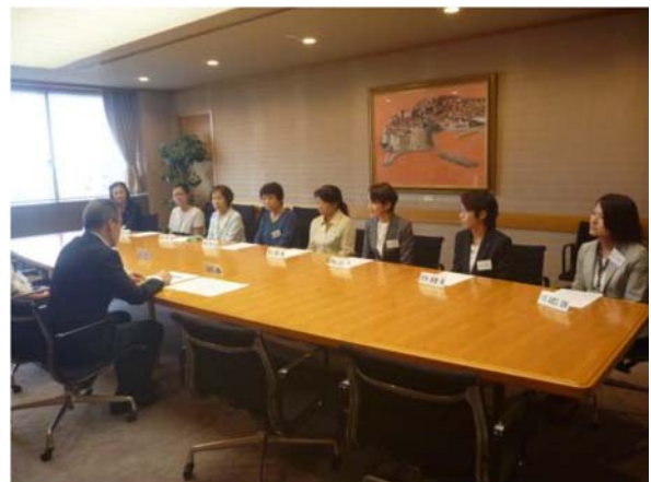
船橋市長からの委嘱状交付式