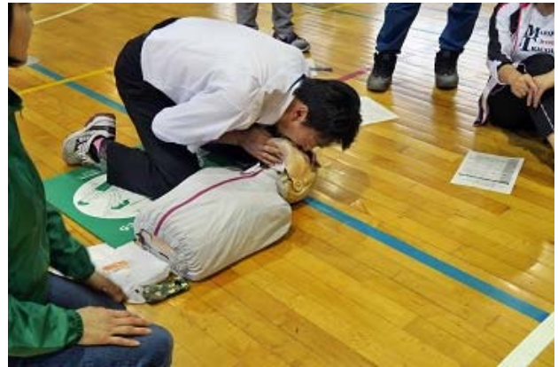
教職員への人工呼吸の実技講習

によって、受講者の習得内容が異なってしまうことを防ぎ、講習の質と成果を均一の高いレベルに保つことを目的とした優れた教育方法と言えます。