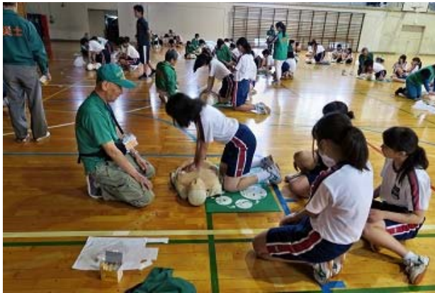
生徒への胸骨圧迫の実技講習