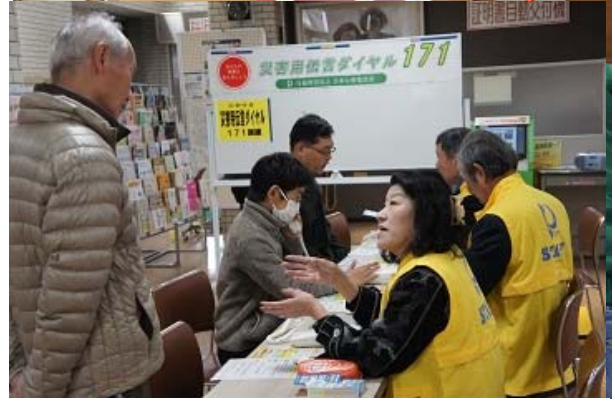
災害用伝言ダイヤル171の体験訓練