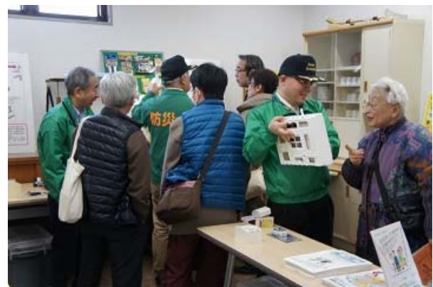
家具転倒防止器具等展示説明