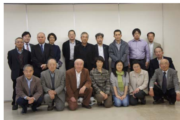
出席者で記念撮影