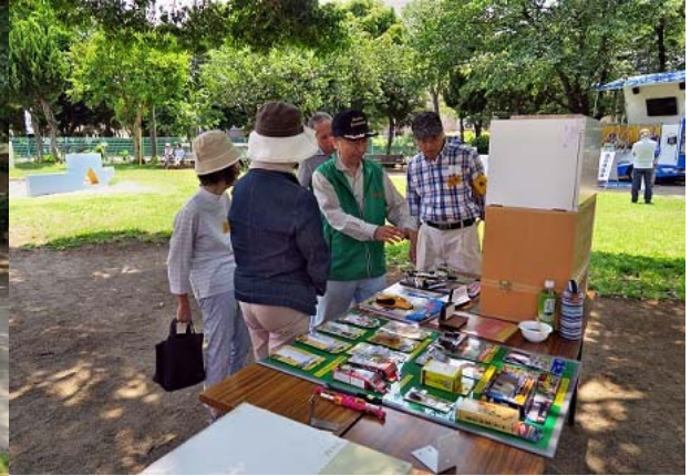
家具転倒防止器具の展示・説明