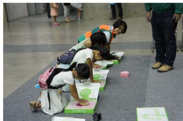
昨年のそら博の様子(左)地震体験車、(右)胸骨圧迫講習