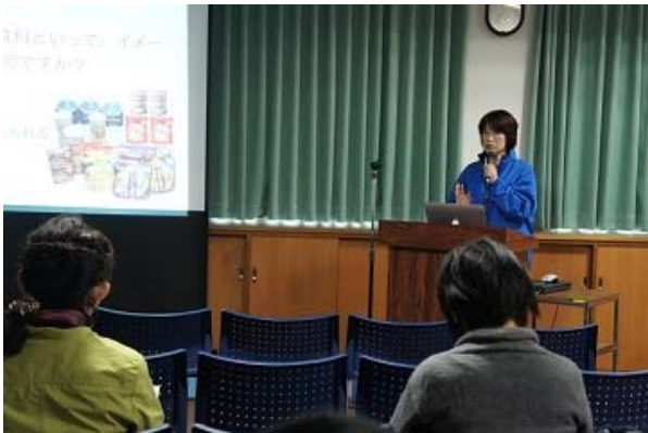
講演「災害用備蓄品」