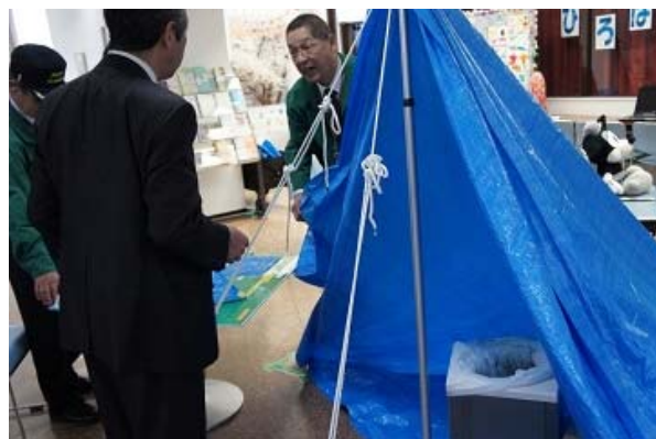
ブルーシート張り講習