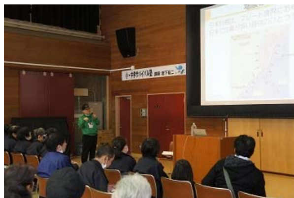
講演「自然災害から身を守ろう」

桜丘区民センターは年間約 10 万人の区民が利用し、地域住民が集う地域の重要な活動施設です。この施設を活用し、東日本大地震から 5 年目の節目の本年、春の火災予防運動実施期間に合わせて、各種防災講演、地域防災リーダーの養成研修、防火・防災教室、防災展示活動などを 2 日間にわたり集中的に開催し、地域の防災意識を高め防災力を強化することを目的として企画されました。このような規模の大きい防災行事は同センターとして初めての試みで、実行委員会には桜丘区民センター、桜丘町会、桜丘南町会、世田谷消防署、地元消防団、世田谷総合支所地域振興課・防災担当・まちづくり担当・まちづくりセンター、商店街振興組合、NPO 桜丘まちづくり、小中学校、区児童館、区図書館などの関係者が参画し、日本防災士会各支部と日本公衆電話会などが協力しました。