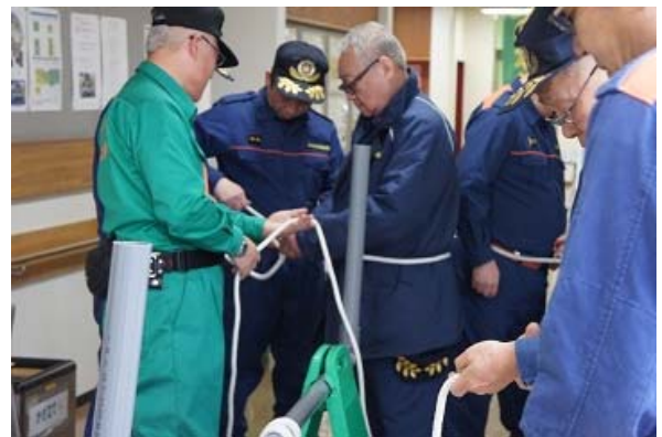
ロープワーク訓練