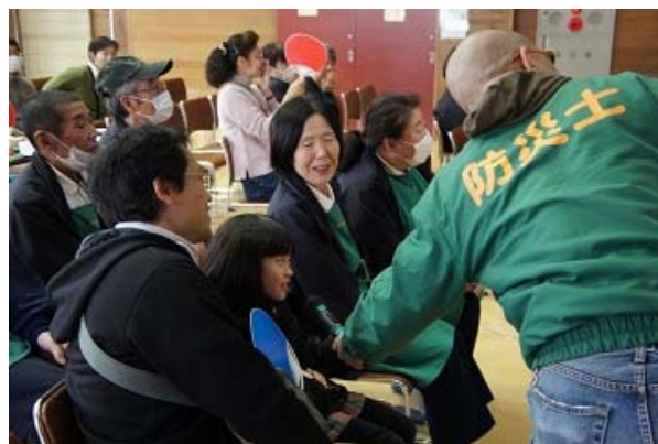
防災士に挑戦！クイズ

参加者で 5～6 名の即席のチームをいくつか作り、チーム内で相談して回答を決めるといふ、クイズのルール説明があり「皆で相談して決めるという訓練が災害時に役立ちます」との講師の言葉に、「なるほど！」と納得してクイズゲームがスタート。