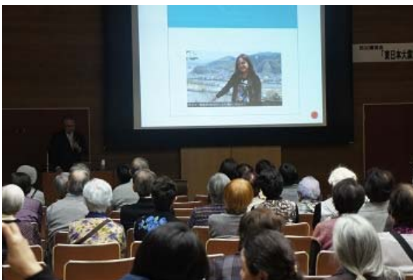
講演「東日本大震災から5年」